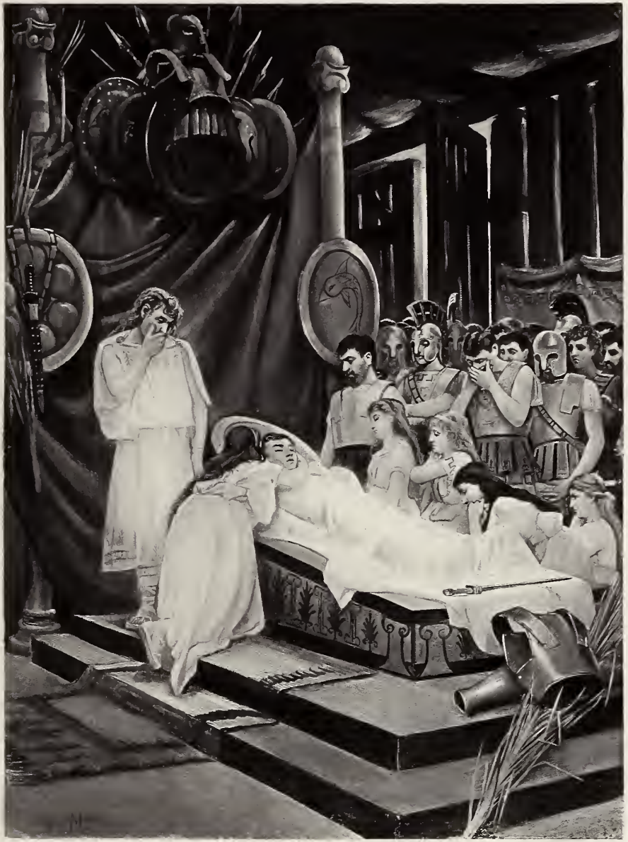
H MOTTE INV